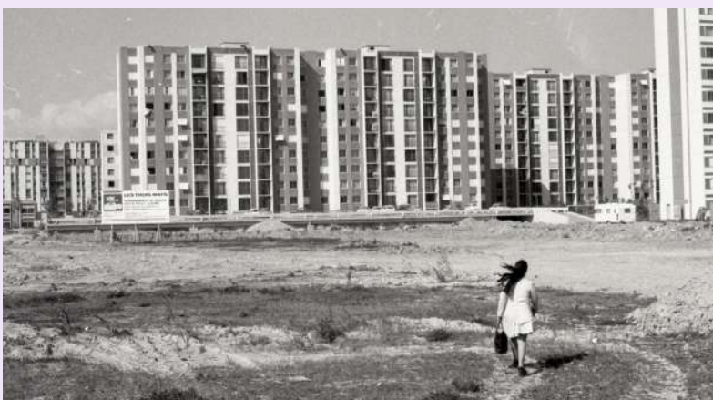
Construction des Trois Mâts, avril 1974, photographie N & B, FRAC69256_1Fi8_1970, collection Archives municipales de Vaulx-en-Velin © D.R.