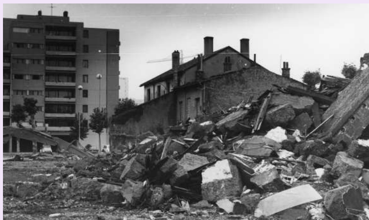
Démolition et construction au Tonkin, 1982, photographie N & B, FRAC069266_27Fi307-003