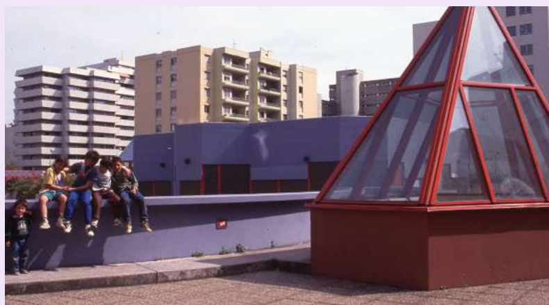
Groupe de 5 enfants devant la médiathèque du Tonkin, 1992, diapositive couleur, 30 x 20 cm, FRAC069266_5Fi1087, collection Archives du Rize, Villeurbanne © O.V.I.D.E.