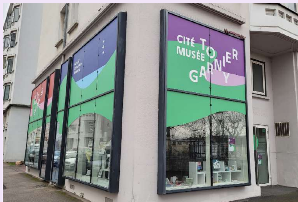
Vitrines et entrée de la Cité Musée Tony Garnier rue des Serpollières, Lyon 8