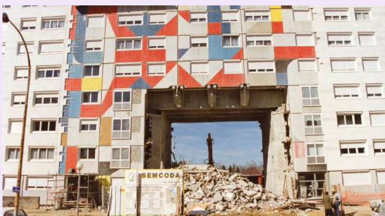
Arche de la paix - Alagniers, non datée, photographie couleur, 1Fi_351, collection Archives municipales de Rillieux-la-Pape © D.R.