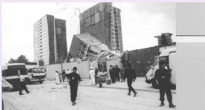
Démolition de la tour 43 (43 boulevard Lénine), quartier de la Darnaise, 1989, photographie N & B, 30 x 20 cm