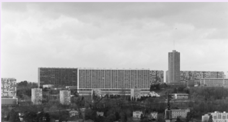
La Duchère, non datée, photographie N & B