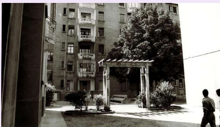
Cour de la cité des États-Unis, années 1980, photographie N & B, 19 x 14,2 cm, collection Comité d'intérêt local du quartier des États-Unis