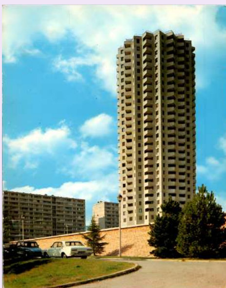
Lyon La Duchère, la tour panoramique, 1975, carte postale, 11 x 15 cm, 4FI_6265