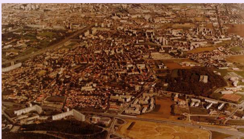
Vue aérienne de Bron, photographie couleur