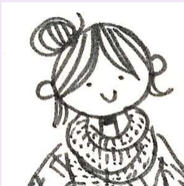
Marion Cluzel illustrée par elle-même © Marion Cluzel