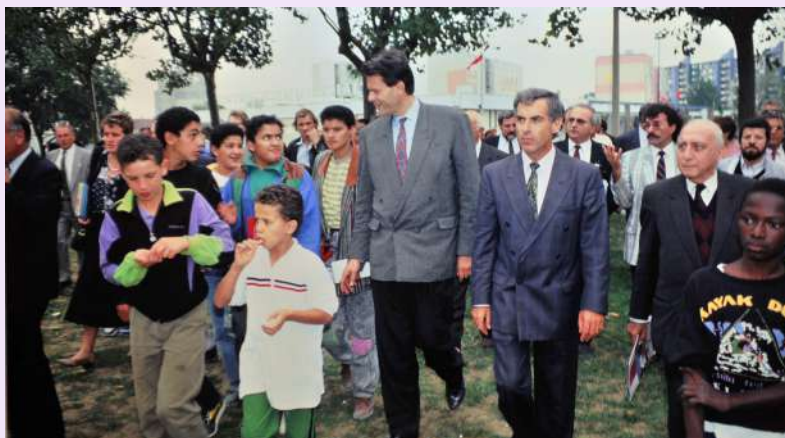
Inauguration du quartier du Nouveau Mas du Taureau, à l'issue d'une opération de rénovation urbaine entreprise en 1985 faisant figure de modèle de la politique de la ville, en présence de Michel Noir, président de la Communauté urbaine, Maurice Charrier, maire de Vaulx-en-Velin, et Gilbert Chabroux, 1990, photographie couleur, 0780WM202