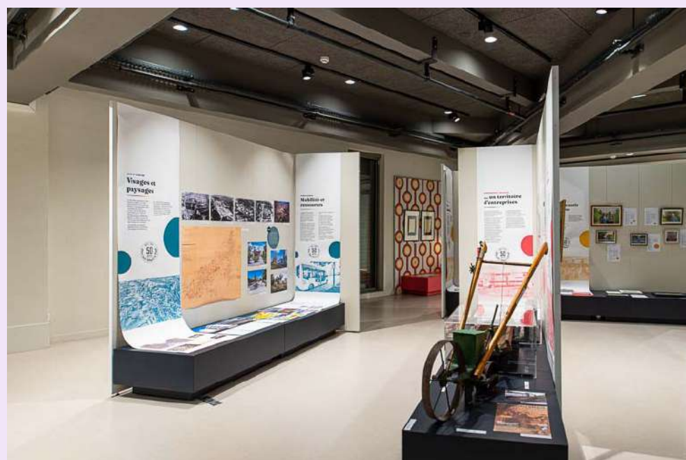
Vue de l'exposition « Portraits » à Rillieux-la-Pape (2022)