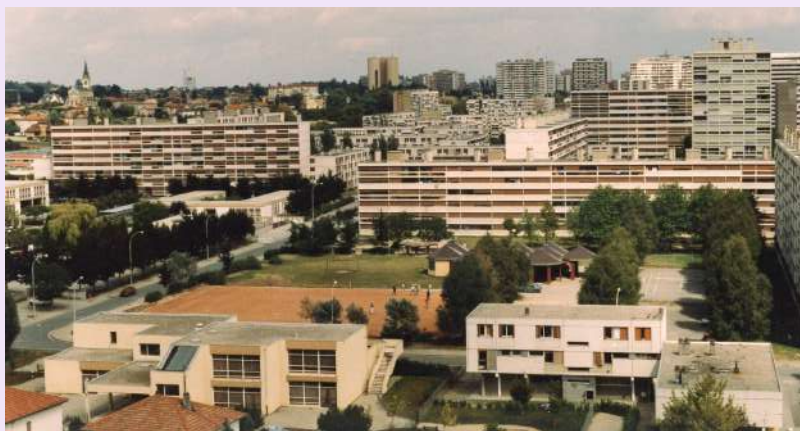
Vue de la ZUP, non datée, photographie couleur, 1Fi_324, collection Archives municipales de Rillieux-la-Pape © D.R.