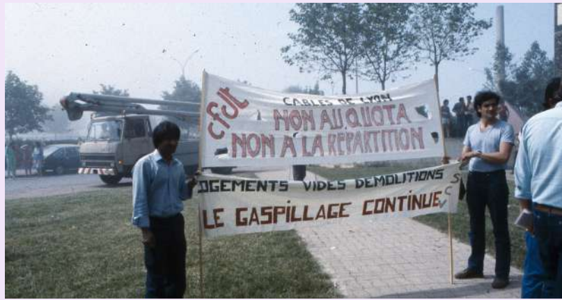
Manifestation contre les logements vides à Monmousseau, 1983, photographie couleur, 20 x 15 cm