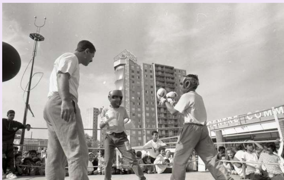
Animation boxe organisée par la Maison des jeunes et de la culture, septembre 1990, photographie N & B, collection Archives municipales de Vaulx-en-Velin © D.R.