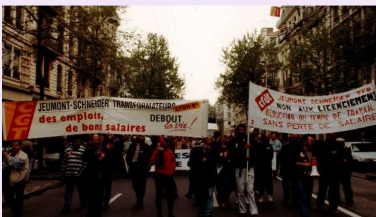
Manifestation à Lyon 8, non datée, photographie couleur, 14,9 x 10,2 cm, collection CMTG © D.R.