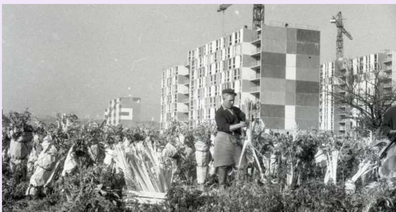
ZUP, chantier 1974, 4, 1974, photographie N & B